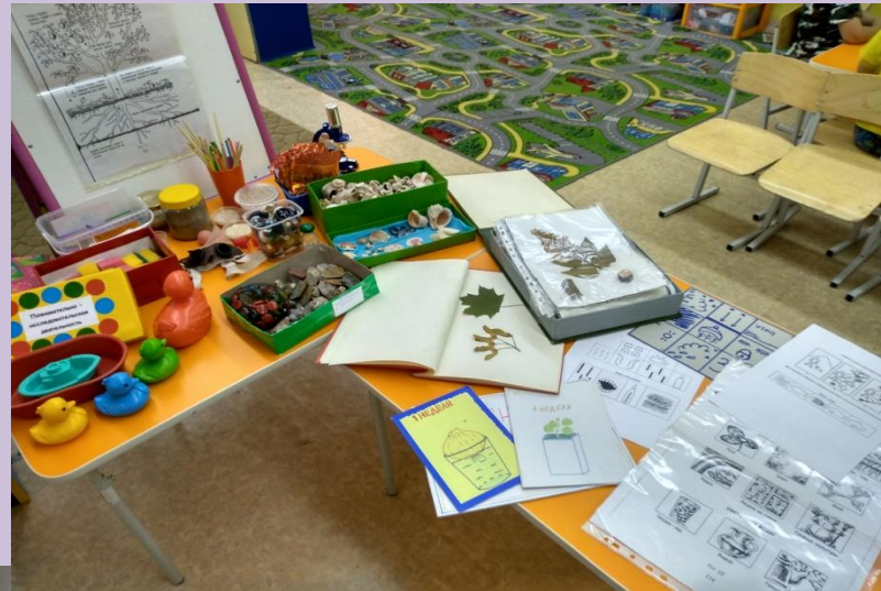
Центр природы и экспериментирования