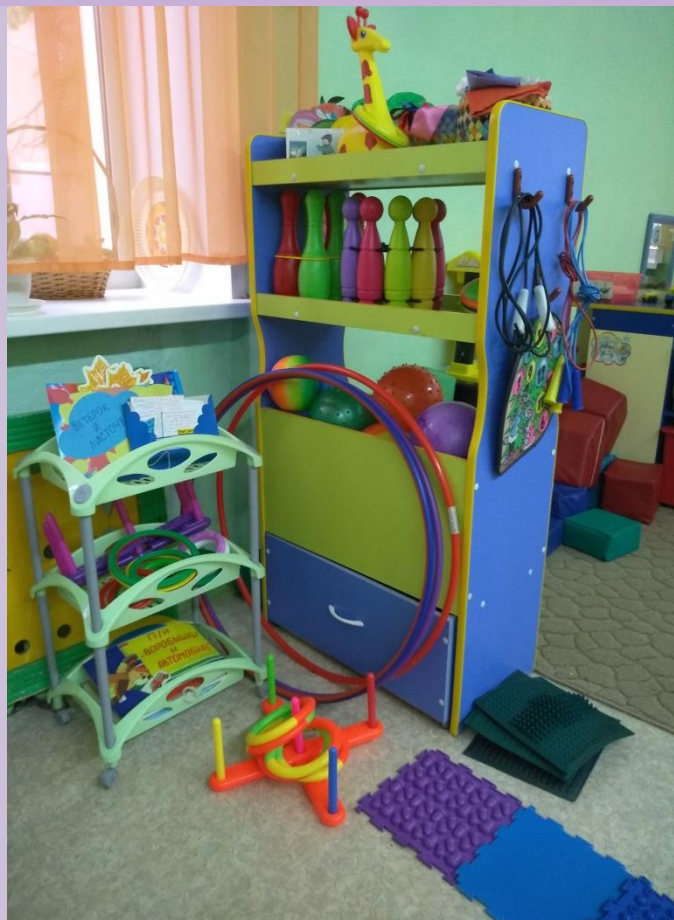
Центр физического развития