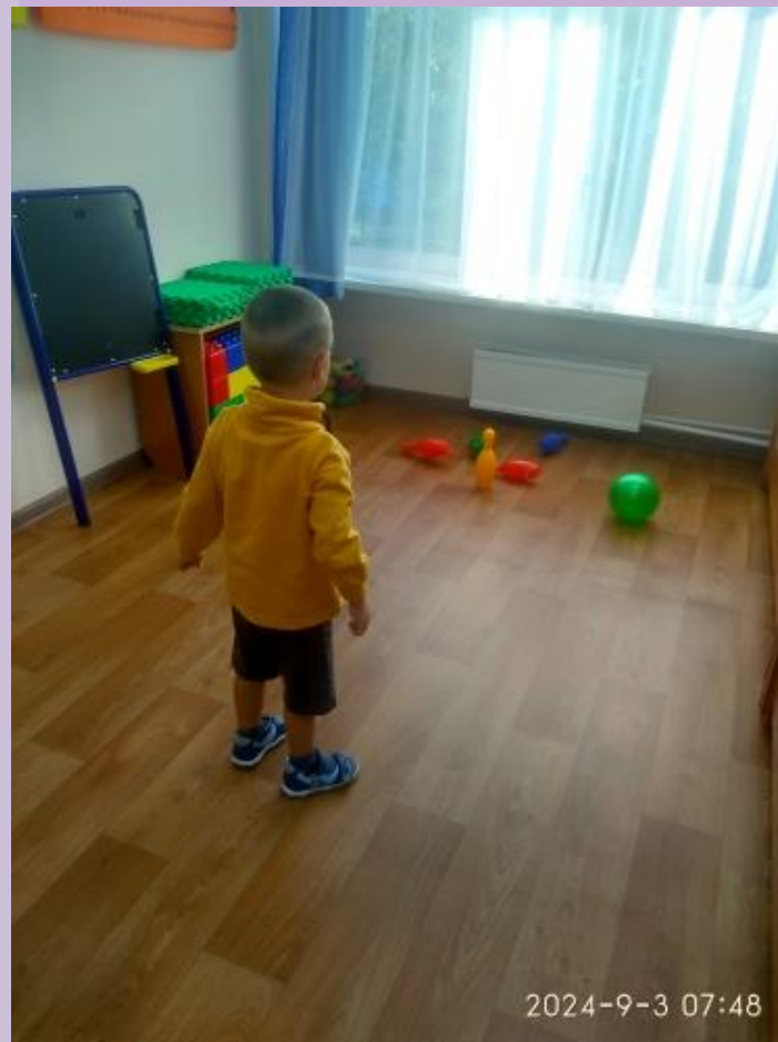
Развивающие игры с кеглями