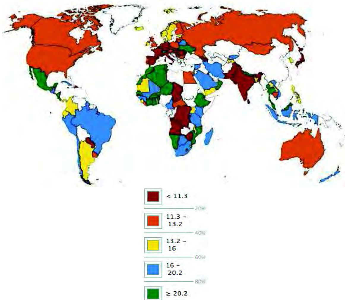
Рис. 1 Государственные расходы на образование в % от общих государственных расходов (2006–2012г.г.)

На карте (рис. 1) представлены данные о государственных расходах на образование в различных регионах мира 13 .