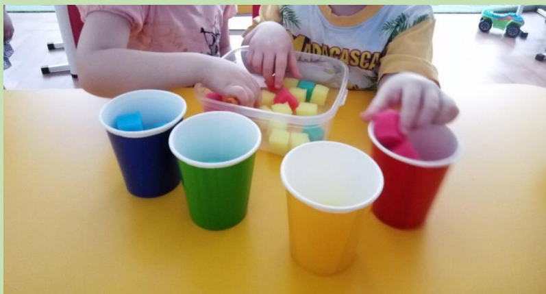
Дигра «Разложи по цвету»