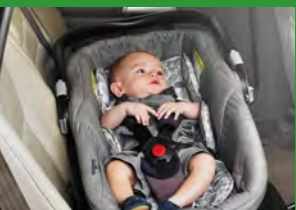
Автокресло «люлька» группы 0 (для детей массой < 10 кг)*

При покупке детского удерживающего устройства обязательно следует уточнить у продавца наличие сертификата на товар!