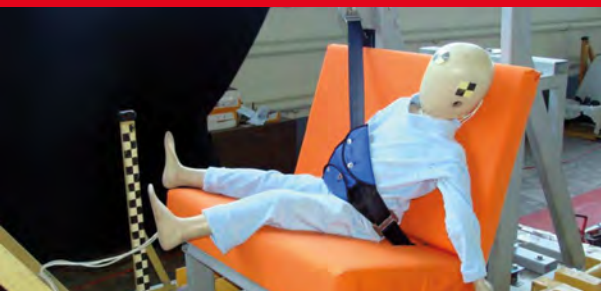
Результаты тестов использования небезопасных удерживающих устройств*

Дополнение определения «направляющая ляжка» в Правилах ЕЭК ООН № 44-04 было одобрено Всемирным Форумом (WP.29). Внесенная поправка к формулировке указывает на то, что « направляющая ляжка рассматривается как составной элемент детской удерживающей системы и НЕ может отдельно официально утверждаться в качестве детской удерживающей системы в соответствии с настоящими Правилами». Это исключает даже формальную возможность сертификации устройств типа «направляющая ляжка»!