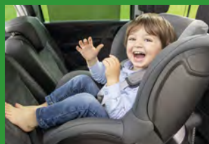
Автокресла групп I (для детей массой 9-18 кг)*