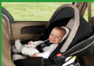
Автокресло группы 0+ (для детей массой < 13 кг)*