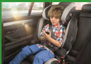
Автокресло группы II и III (для детей массой 15-36 кг)